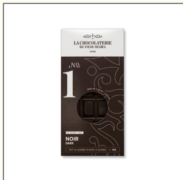
TABLETTE DE CHOCOLAT - LE TOUT NOIR